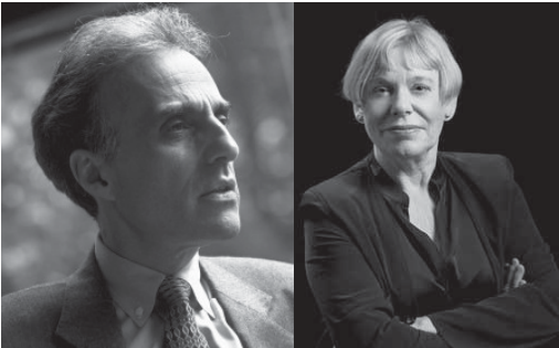
ജോൺ എൽ എസ്‌പോസിറ്റോ കരൺ ആംസ്ട്രോങ്ങ്

അറബികളും പ്രാചീന ഇസ്രായേൽ നിവാസികളും സെമിറ്റിക് വിഭാഗത്തിൽപ്പെടുന്നവരാണ്. ഹിബ്രൂ, അറബി എന്നിവ സെമിറ്റിക് ഭാഷാ കുടുംബത്തിൽ ഉൾപ്പെടുന്ന ഭാഷകളാണ്. ഇസ്‌ലാമും ജൂതമതവും തമ്മിൽ ഘടന, നിയമം, ആചാരങ്ങൾ, മൂല്യങ്ങൾ എന്നിവയുടെ തലത്തിലുള്ള സാധർമ്മ്യം മറ്റേത് മതവിഭാഗങ്ങളേക്കാളും