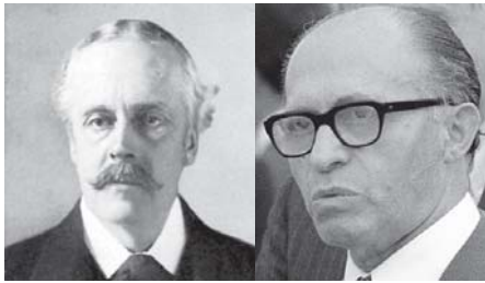
ആർതർ ജെയിംസ് ബാൽഫർ മേനച്ചം ബെഗ്

രെയും മൂച്ചുടും നശിപ്പിക്കാൻ വെമ്പുന്ന ഏറ്റവും കടുത്ത ആന്റി സെമിറ്റിക്കുകളുമായി (ക്രൈസ്തവ സയണിസ്റ്റുകൾ) പങ്കുചേരാൻ സയണിസ്റ്റുകൾ മടിക്കുന്നില്ല എന്നത് അവരുടെ ജൂതവിരുദ്ധതയുടെ കൂടി തെളിവാണ്.