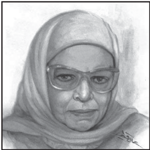
← ആഇശ: അബ്ദുർറഹ്മാൻ

قال അവൻ പറഞ്ഞു (529) يقولون അവർ പറയും/അവർ പറയുന്നു (92), قالوا അവർ പറഞ്ഞു, قل താങ്കൾ പറയൂ(332), قولوا നിങ്ങൾ പറയൂ(13), قيل പറയപ്പെട്ടു(49), قولواക്ക് (52), قولهم അവരുടെ വാക്ക്(12) എന്നിങ്ങനെയാണ് പ്രയോഗിച്ചിരിക്കുന്നത്. ഖുർആനിൽ ഈ പദരൂപങ്ങൾ ഇത്രയും വർദ്ധനവയായ രൂപത്തിൽ പ്രയോഗിച്ചതിൽ നിന്ന് താഴെ വസ്തുതകൾ ഗ്രഹിക്കാം: