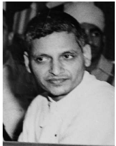
നാമുറാം വിനായക് ഗോദ്സെ

ഇന്ത്യാ മൂവ്മെന്റിൽ ദശലക്ഷക്കണക്കിന് ഹൈന്ദവരും മുസ്ലിംകളും ക്രൈസ്തവരും സിഖുകാരും രാജ്യത്തിന്റെ ഓരോ മൂക്കുമൂലകളിലും അണിനിരന്നപ്പോൾ ഹിന്ദുത്വർ ബ്രിട്ടീഷ് യത്നങ്ങൾക്ക് പിന്തുണ നൽകി കൊലച്ചതി ചെയ്യുകയായിരുന്നു.